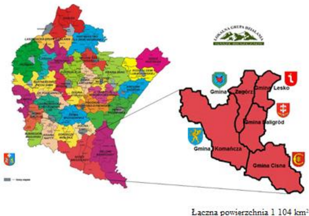
Mapa 1. Mapa obszaru objętego LSR z zaznaczeniem granic poszczególnych gmin wykazująca spójność przestrzenną obszaru objętego LSR

kulturowo, społecznie, gospodarczo – ekonomiczny i środowiskowo. Łączą go tradycje historyczne, tożsame zasoby przyrodnicze i naturalne oraz wspólne dziedzictwo kulturowe.