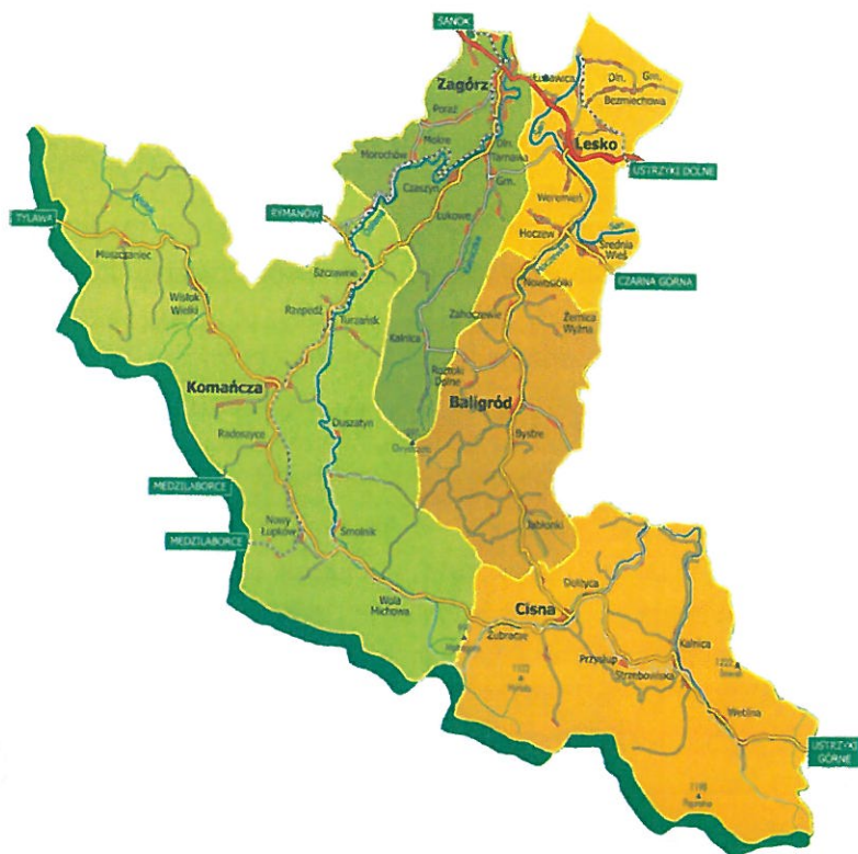
Mapa 1. Obszar gmin objęty LSR